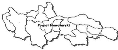
Burze z gradem 2023-07-25 05:20